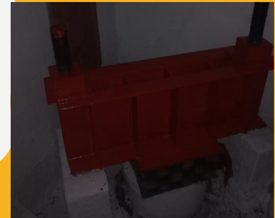
Imagen del sistema de nivelación de los edificios

Dicho lo anterior es que se establece el mapa de evacuación según las dimensiones de los espacios designados como zonas de menor riesgo y el aforo que marcan las normas del protocolo Interno de Protección Civil