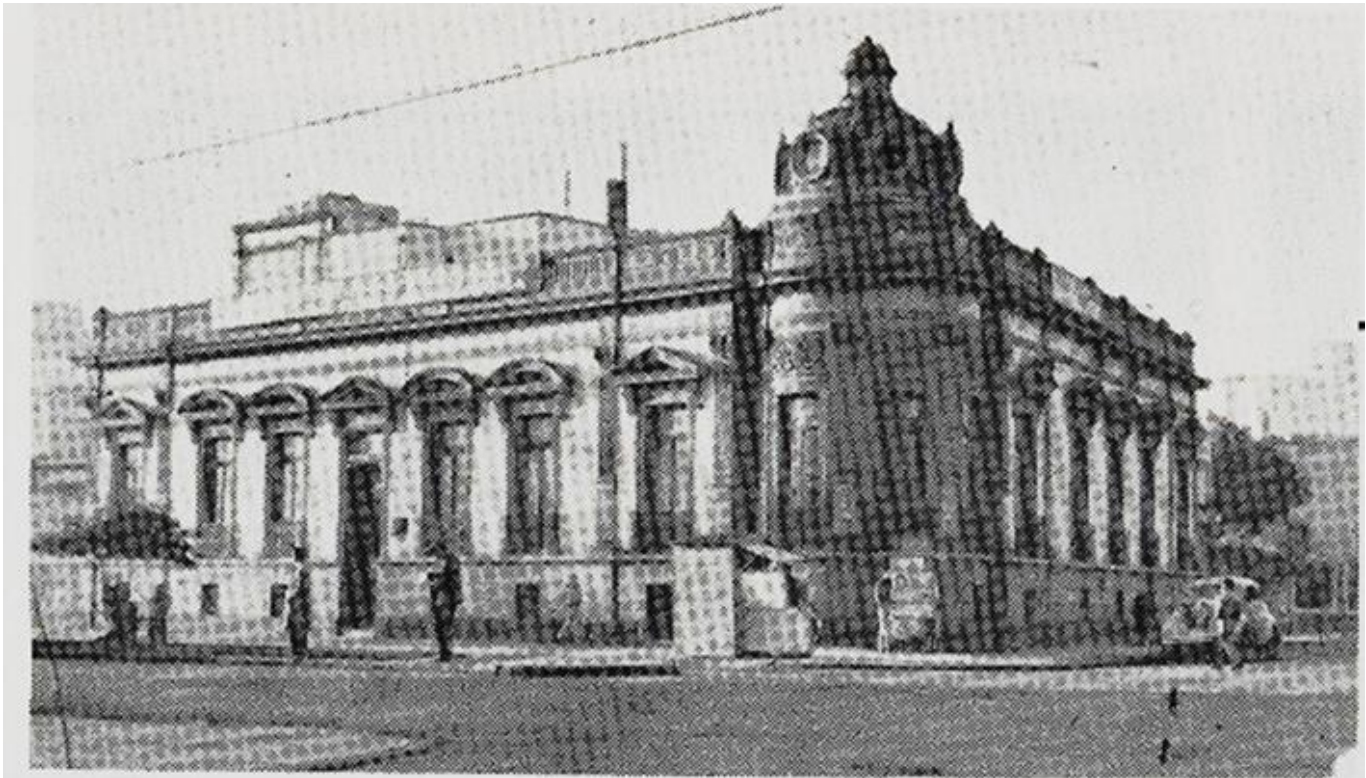
Escuela Nacional de Medicina Homeopática en Gómez Farías 40 y Sadi Carnot 52

Es hasta 1972, que el Presidente Luis Echeverría Álvarez, le asigna el espacio donde actualmente se encuentra y se construyen los dos edificios principales y definitivos.